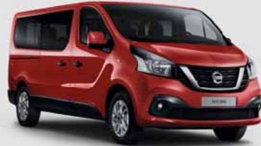
Nissan NV300 Premium Kombi L1H1 2.7 dCi170, DCT-Automatik, 125 kW (170 PS), 8-Sitzer, Diesel