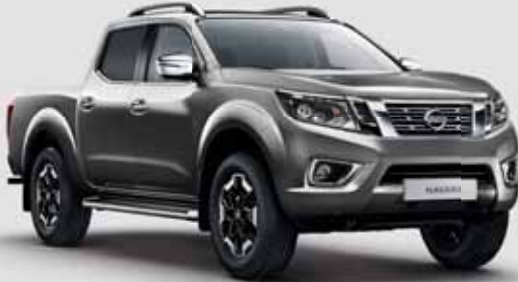
Nissan Navara N-Connecta 2.3 dCi 6MT, 120 kW (163 PS), 4x4, Doppelkabine, Diesel